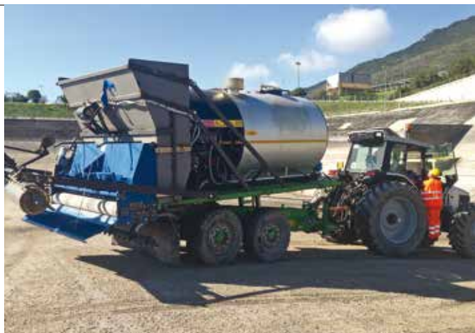
2. Il prototipo per l'applicazione del MBSM

gettisti ha sviluppato l'idea di riadattare i classici trattamenti multistrato per le pavimentazioni stradali all'ambito delle impermeabilizzazioni su paramenti inclinati dei bacini idraulici. Se la tecnologia in sé, quindi, non rappresenta una novità costruttiva, l'applicazione su superfici inclinate e pendii è una vera e propria innovazione, oggi tutelata da un brevetto depositato.