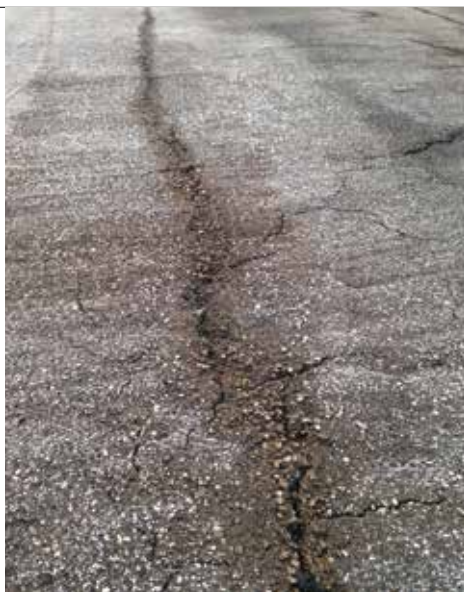
5. Le fessure del paramento visibili dopo l'idrodemolizione