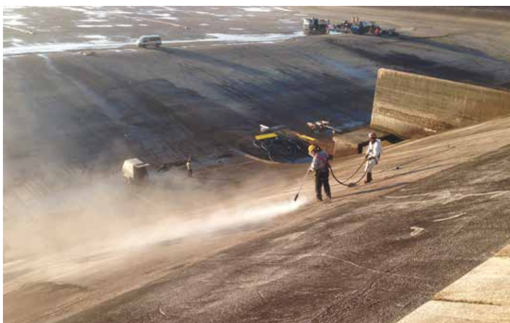
4. Le operazioni di pulizia del paramento

stratificazioni di MBSM sono equiparabili ad uno strato in conglomerato bituminoso da 3 cm dal punto di vista della resistenza alle azioni meccaniche di impatto.