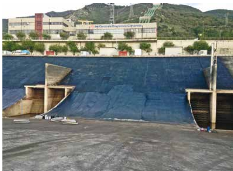
11. L'aspetto del manto dopo applicazione dell'MBSM

(3) Ingegnere, Amministratore e Direttore Tecnico di Pavenco Pavement Engineering Consulting Srl