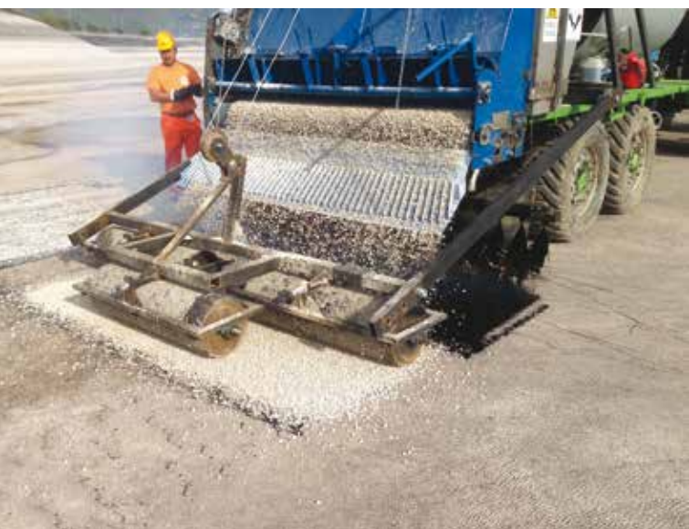
6. Il campo prova e settaggio del macchinario prima dell'applicazione

La prima applicazione della membrana MBSM da parte di CEA è avvenuta nel bacino idrico di Presenzano (CE), dove risiede una delle più importanti centrali idroelettriche di ENEL SpA, nell'ambito dei "Lavori di ripristino della tenuta del paramento di monte".