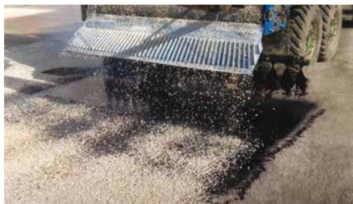
1. Il momento dell'applicazione del MBSM

Come è facile immaginare, se da un lato la tipologia dei materiali non differisce molto rispetto alle tradizionali applicazioni in campo stradale, le maggiori complessità si incontrano nella fase di posa in opera. La tecnica di stesa, concettualmente, è