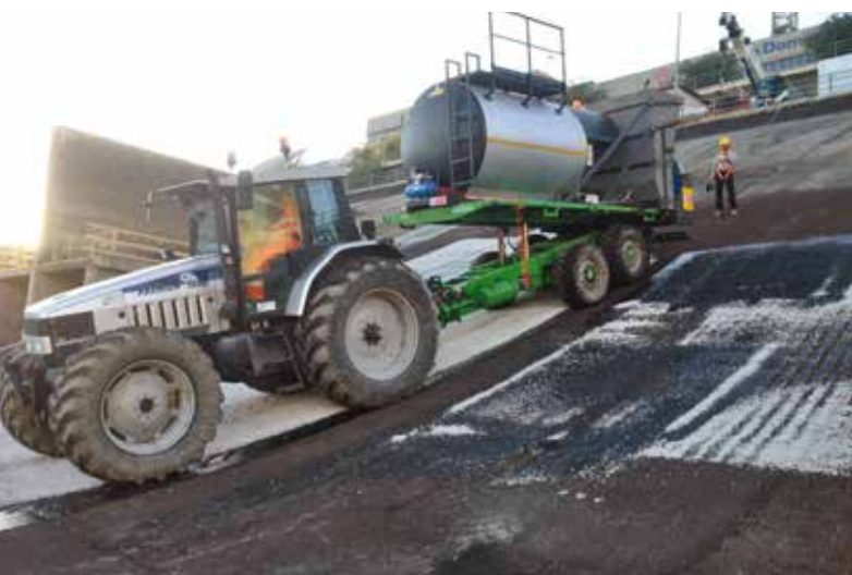
9. La fase di applicazione del MBSM sul paramento del bacino