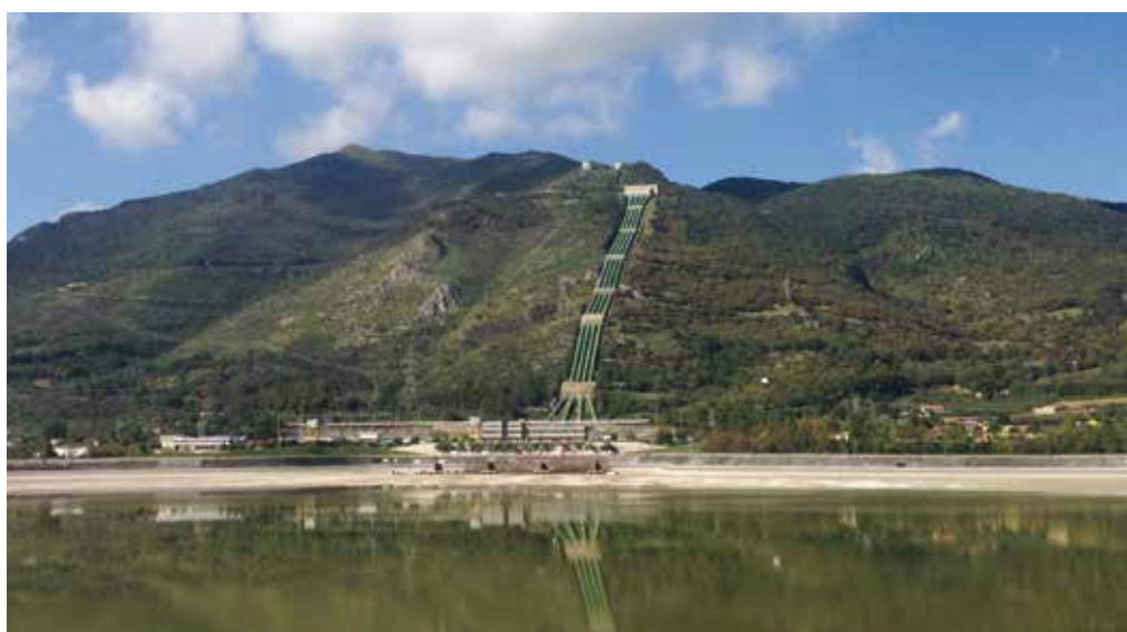
3. Il bacino di valle della centrale ENEL Domenico Cimarosa di Prezenzano (CE)

Il trattamento impermeabilizzante può essere applicato sullo strato da impermeabilizzare molteplici volte in base al grado di copertura e protezione che si intende raggiungere. Studi di laboratorio hanno dimostrato che la sovrapposizione di tre