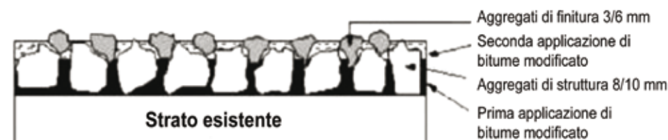
7. La composizione tipo della membrana MBSM

La Domenico Cimarosa è una centrale che si trova nella vallata del Volturno fra le provincie di Caserta, Isernia e Frosinone, ed è un impianto a ciclo chiuso per 1.000 MW totali, costituito da due bacini dalla capacità di circa 6 milioni di m 3 cadauno e un dislivello relativo tra gli stessi di circa 500 m.